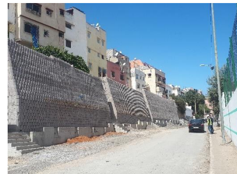
Avancement vue du parement