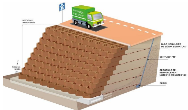
Schéma-type de la solution