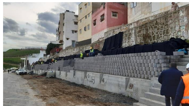
Pose rang par rang des blocs, géo grille et géocomposite de drainage