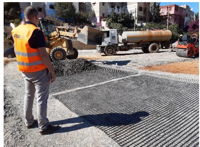
Campagne d'essai d'endommagement supervisée par AFITEXINOV